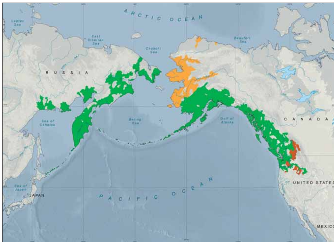
Рис. 1. Ареал анадромной нерки. Обозначено: зеленым – современное устойчивое воспроизводство, желтым – ограниченно встречается, красным – исторически встречалась (по: Atlas of Pacific Salmon, 2005)

Бассейны всех озер, особенно мелководных и хорошо прогреваемых, используются птицами для гнездования и питания (Лобков, 2002).