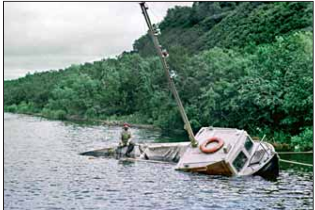
Рис. 9. После шторма на оз. Азабачьем (июль 1986 г.)

Так как азиатское побережье северо-западной части Тихого океана не является основным мировым центром репродукции нерки, в настоящей работе (в качестве дополнения) рассмотрены некоторые наиболее значительные и уникальные озера Северной Америки, служащие местом нагула и нереста этого вида.