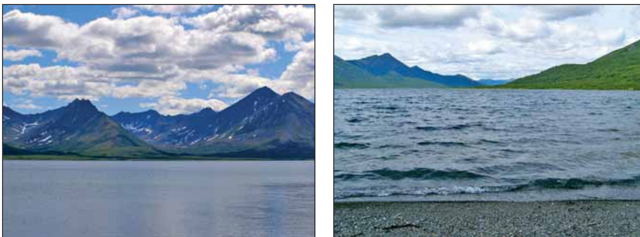
Рис. 7. Озера Корякского нагорья – Потат-Гытхын (слева) и Илур-Гытхын (справа) (июль 2006 г.)

Все привлеченные в книгу материалы снабжены ссылками на источники, как это принято в научной литературе. При этом следует подчеркнуть, что в настоящем издании использованы только опубликованные сведения, в исключительных случаях дополненные персональными сообщениями авторитетных специалистов.