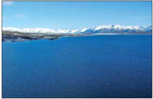
Рис. 4. Оз. Паланское – расположено на Северо-Западе Камчатки (октябрь 2006 г.)