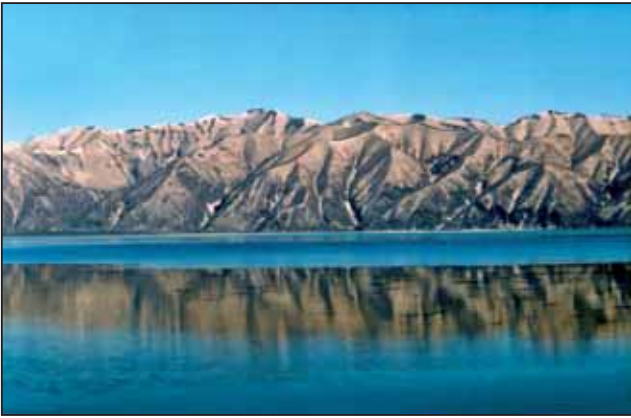
Рис. 3. Оз. Азабачье (бассейн р. Камчатки) – горы покрыты снегом от извержения влк Шивелуч в ночь с 9 на 10 мая 2004 г. (5 июня 2004 г.)