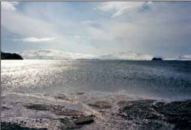
Рис. 8. Оз. Курильское – расположено на Юго-Западе Камчатки (апрель 1998 г.)

Большинство озер, которые посещают, люди впервые видят или с самолета, или с вертолета. Когда в первый раз подлетаешь к озеру, то вначале оно кажется загадочным и неведомым. Но когда поживешь на озере или проведешь полевой сезон, возвращаясь в следующий раз через год, после кратковременного налета загадочности и дикой красоты водоема начинаешь с птичьего полета отыскивать уголки, где ты жил и работал, где сидел у костра и где (за долгую жизнь бывает и такое) однажды едва не погиб в силу сложившихся неблагоприятных обстоятельств или собственной глупости. После таких случаев ты начинаешь уважать озеро, приравниваешься к его характеру и уже осознанно принимаешь решения, когда собираешься ехать куда-то в ненастную погоду и зная, что из этого может получиться.