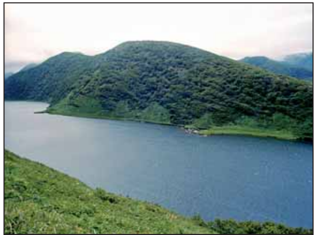
Рис. 6. Оз. Токотан (о-в Уруп) – здесь нерестится и нагуливается нерка (2 августа 2006 г.)

1937; Огиевский, 1951; Чеботарев, 1964; Томирдиаро, Крохин, 1970; Пармузин, 1975; Остроумов, 1985а, 2007).