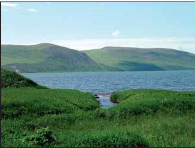
Рис. 5. В бассейне оз. Саранного (о-в Беринга) воспроизводится довольно крупное стадо нерки (18 июля 2000 г.)