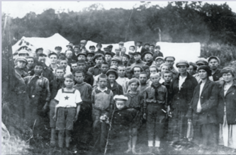
Первый пионерский лагерь п. Сероглазка. 1924 г.

«Тяжелыя обстоятельства принуждают нас жителей селения Сероглазка обратиться ...с всепокорнейшей просьбой; боясь, что нас может скоро постигнуть тяжелое положение остаться без рыбы, как для нас и наших собак, благодаря рыбо-промышлен-