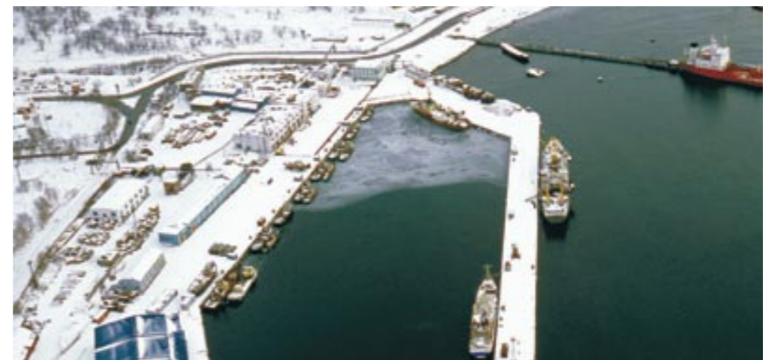
Колхозный причал зимой

В 1929 году в селе был организован колхоз, которому суждено было стать крупнейшим рыболовецким колхозом Советского Союза.