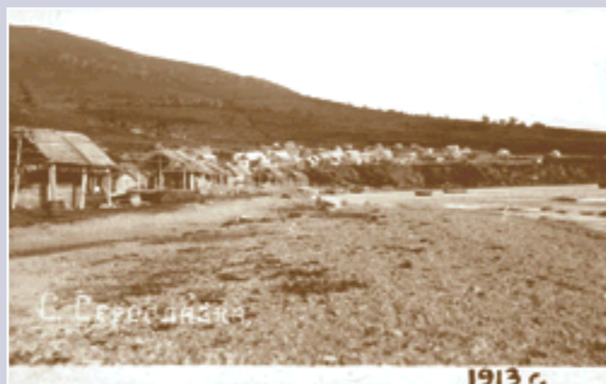
п. Сероглазка. 1913 год.

Камчатка, благодаря личному мужеству и героизму этих людей, их земляков и «родников» из других камчатских поселков, осталась за Россией. Но в целом эта война, как известно, была проиграна. Правительство России и Японии подписали грабительскую для Камчатки рыболовную конвенцию, по которой японцы получали свободный доступ к камчатскому побережью. Для них, правда, были закрыты бухты, но японцы и здесь находили лазей-