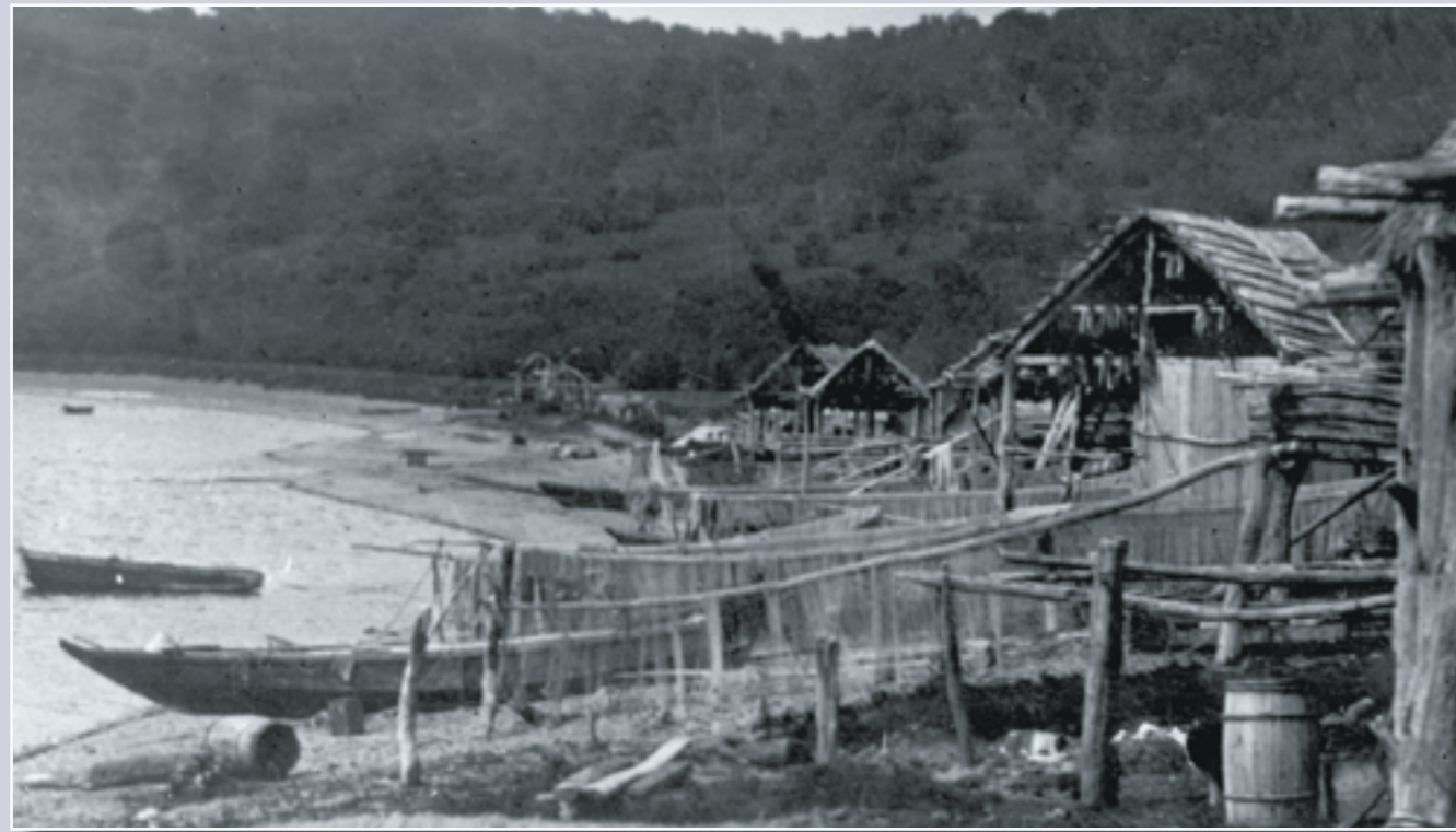
Р-н п. Сероглазка. Начало XX в.

Примером этому может служить следующее: в то время, когда в Тарьинской бухте работал рыбный-консервный завод